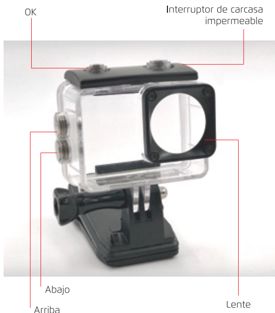
FOTO DE CARCASA IMPERMEABLE